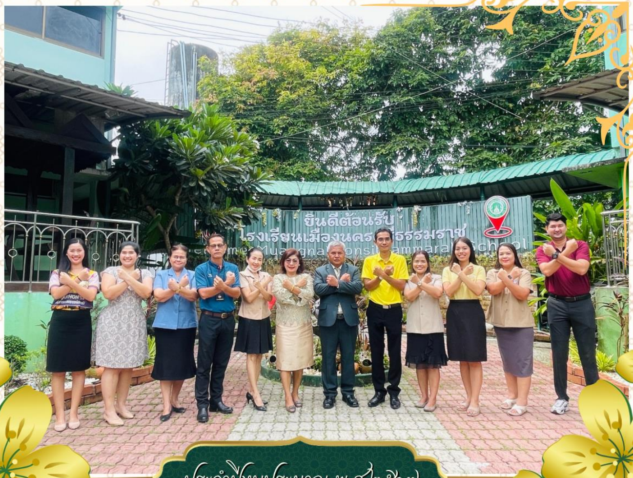
ประจำปีงบประมาณ พ.ศ.๒๕๖๓

โรงเรียนเมืองนครศรีธรรมราช สังกัดสำนักงานเขตพื้นที่มัธยมศึกษาขนาดนครศรีธรรมราช